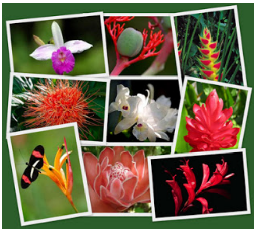
La flora y la fauna en Costa Rica

Marta Moreira, www.elindependiente.com , 30/06/2018