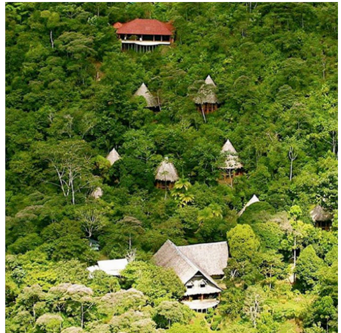
El hotel Luna Lodge