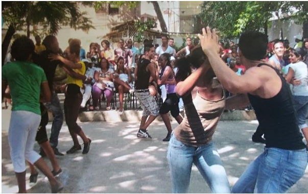
C- Parejas bailando en la Habana (Cuba), 2018 ( Pura Vida 2de )