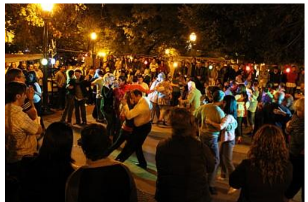
D- Milonga en Buenos Aires (Argentina), ( buenosairesstay.com )