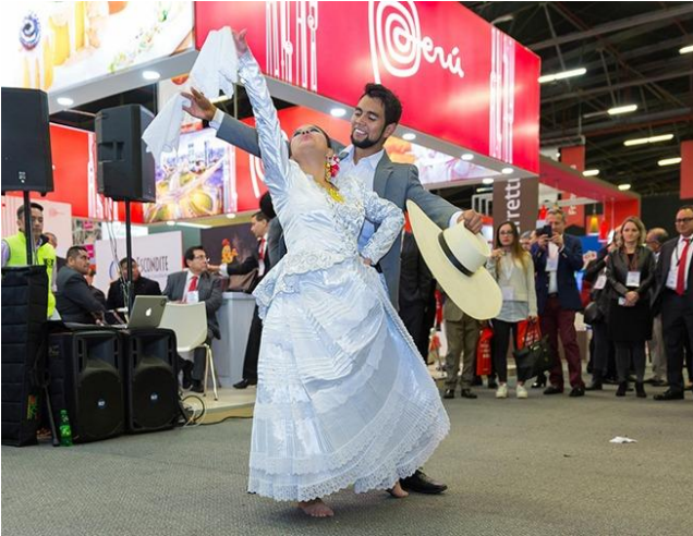
Pareja bailando marinera peruana