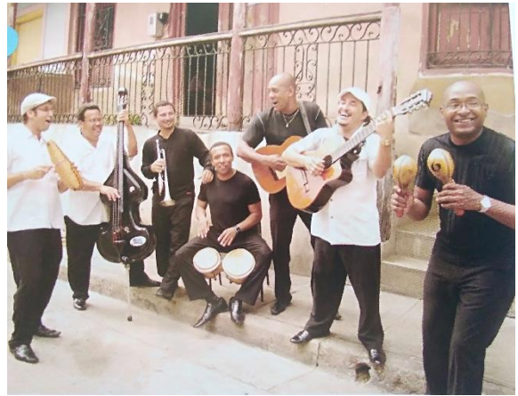
B- Músicos tocando en una calle de la Habana (Cuba), 2010