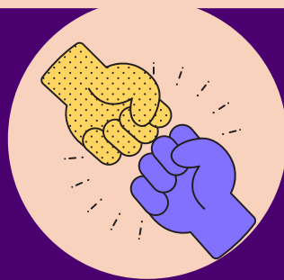
NO a la violencia contra la mujer