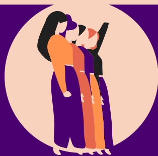
Manos de Mujeres