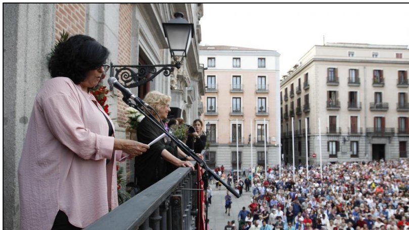
Fotografía de la escritora Almudena Grandes en el balcón de la Casa de la Villa, Madrid, durante las fiestas de San Isidro, 2018.

Queridos vecinos, queridas vecinas, camaradas y cómplices de los trabajos y los placeres de la vida en Madrid, gracias por haber venido. Querida alcaldesa, gracias sobre todo a ti, por invitarme hoy a este balcón, un espacio muy pequeño y, al mismo tiempo, el más grande al que puede aspirar una madrileña. (...)