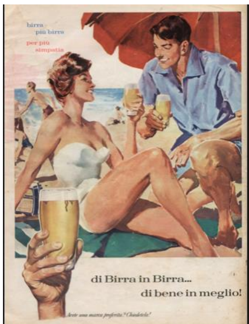
Affiche 5 bis "La donna oggetto negli anni '50"

https://www.giornale.it/2017/07/04/addio-solvi-stubing-la-bionda-della-peroni/