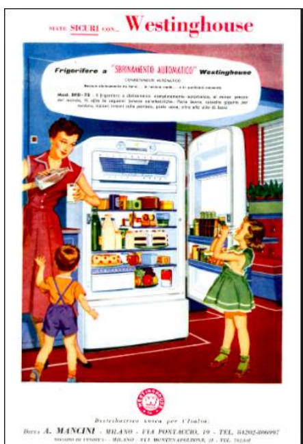
Affiche 4 Bis

https://en.todocoleccion.net/catalogs-advertising/publicidad-moulinex-libera-mujer~x9607402