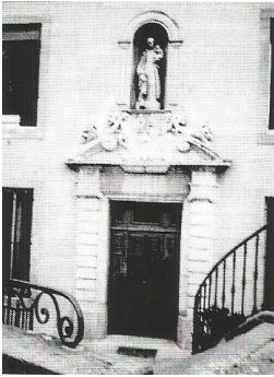
La fachada del orfanato

Explica por qué estas galletas evocan malos recuerdos a Esmaltina (p.45-46)