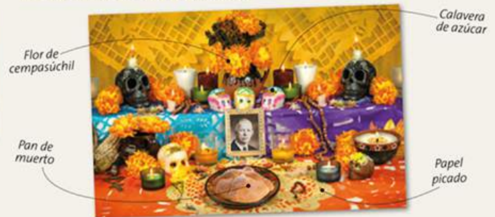
Flor de cempasúchil