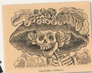
↑ La Catrina original, creada por el ilustrador José Guadalupe Posada (1913)