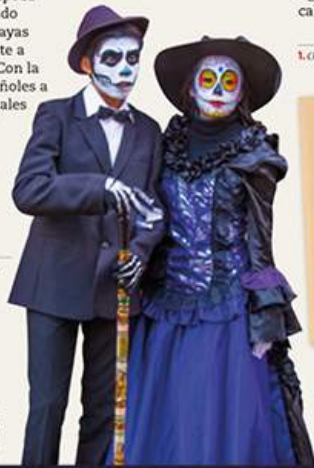
Pareja vestida y maquillada para celebrar el Día de Muertos en Oaxaca (México) →