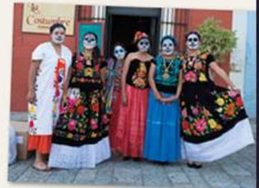
↑ Mujeres disfrazadas de La Catrina con vestidos tradicionales mexicanos.

1. prier 2. autel 3. encens 4. bougies 5. crânes en sucre