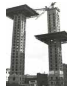
Torres de Colón. Estudio Lamela

Comprenez l'évolution de l'architecture à partir de bâtiments madrilènes. Cette visite vous donne les clés pour appréhender l'édifice à partir de l'évolution des techniques, des matériaux et des principes de l'architecture moderne.