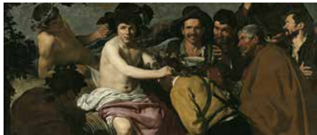
Le Triomphe de Bacchus (détail), Velázquez, Musée National du Prado

Atelier : En binôme, les élèves créent une planche de bande dessinée en lien avec l'univers de la mythologie. Traitant des péripéties d'un héros commun à tous les groupes, les différentes créations sont ensuite réunies pour constituer une seule histoire s'apparentant au périple d'Ulysse.