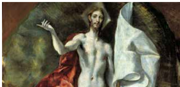
Résurrection du Christ (détail), Le Greco, Musée National du Prado

À l'occasion du 400 ème anniversaire de la mort du Greco, visite didactique du musée du Prado et de l'église des Jerónimos, permettant de décrypter l'art sacré sous plusieurs facettes.