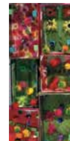
Atelier joyaux végétaux

Impreso en reciclado 100% SILK, 100% reciclado. El Institut français se compromete con el medioambiente.