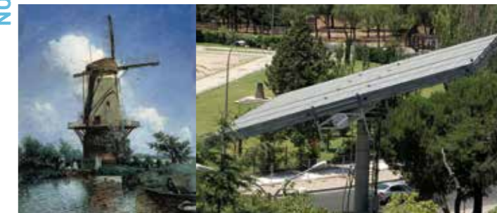
Moulin près de Delft, Jongkind, Musée Thyssen-Bornemisza

Parcours didactique (tout public) : Visite des collections permanentes du Musée Thyssen-Bornemisza sous l'angle des inventions techniques de différentes époques.