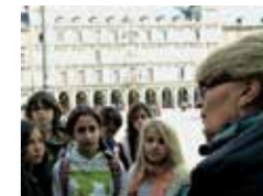
Groupe en la Plaza Mayor

Parcours didactique (tout public, du mardi au vendredi) : Balade dans le centre historique de Madrid pour comprendre les origines de la ville et son histoire à travers quelques lieux emblématiques : Museo de los Orígenes (San Isidro), tour mudéjar San Pedro el Viejo, Plaza Mayor, Plaza de la Villa, Palacio Real. Nous abordons également les personnages liés à l'identité madrilène.