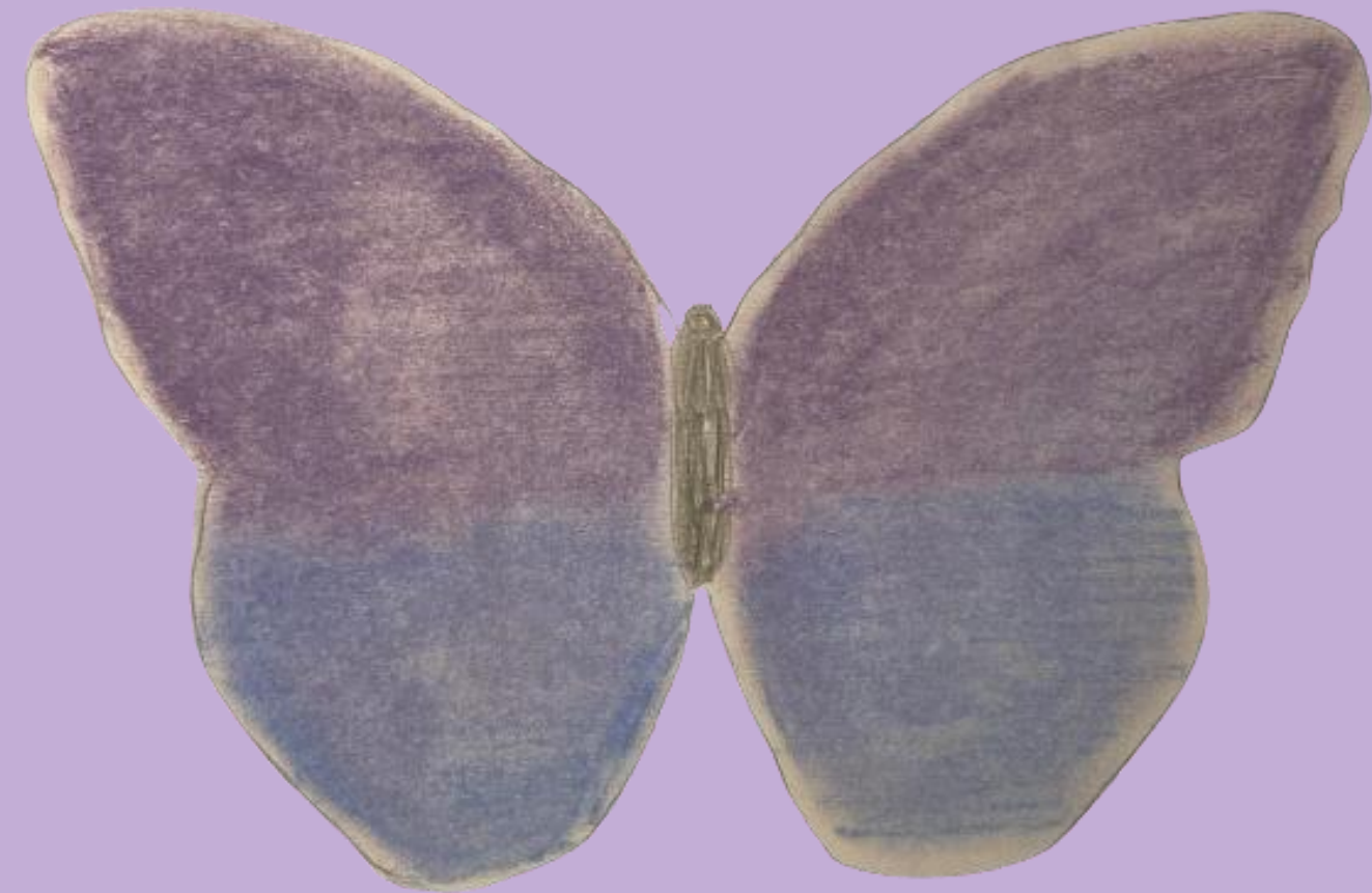
Illustration : Clémence