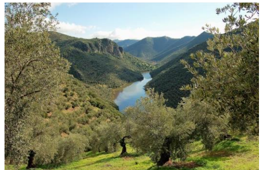
El río Guadalquivir

Federico García Lorca (poeta de Granada)