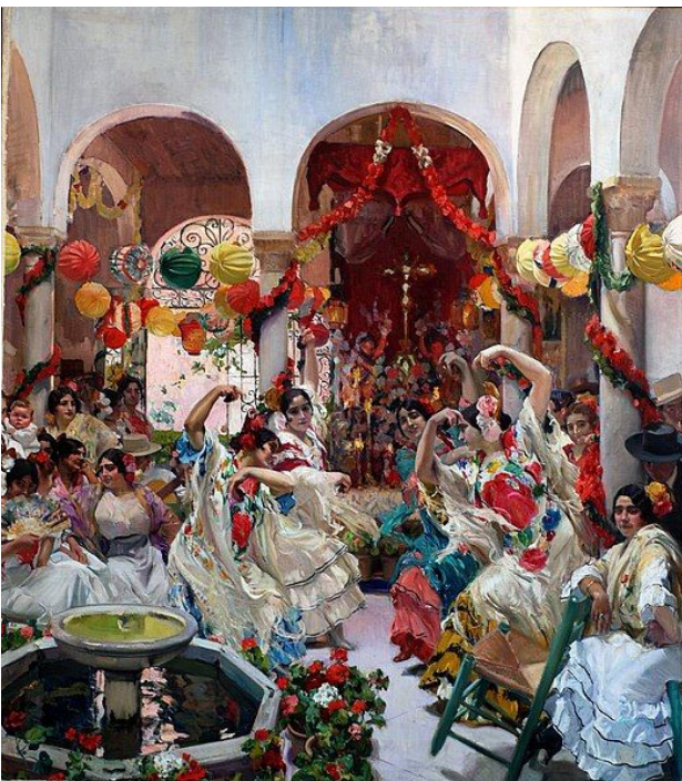
Joaquín Sorolla, El Baile , 1914-1915

EOI: Para ti, ¿qué cuadro ilustra mejor el poema ?. Justifica